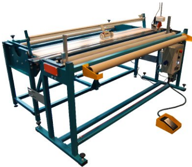
wersja z NT-1/L oraz OT-1/R version with NT-1/L and OT-1/R версия с NT-1/L и OT-1/R