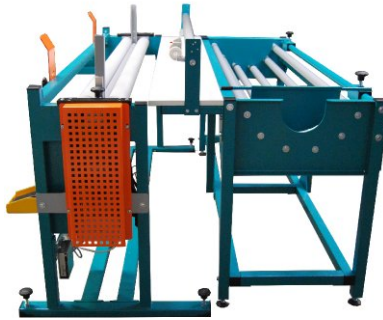
wersja z NT-1/L version with NT-1/L версия с NT-1/L