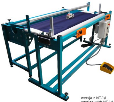
wersja z NT-1/L version with NT-1/L версия с NT-1/L