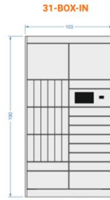
31-BOX-IN steering module V - 18 (61x655x260 mm) S - 9 (440x655x93 mm) M - 2 (440x655x201 mm)