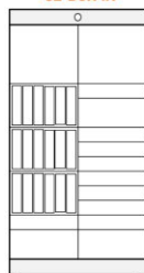
32-BOX-IN additional module V - 18 (61x655x260 mm) S - 9 (440x655x93 mm) M - 3 (440x655x201 mm) L - 2 (440x655x417 mm)