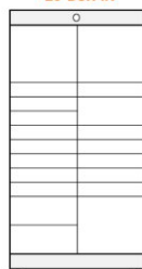
20-BOX-IN additional module S - 14 (440x655x93 mm) M - 3 (440x655x201 mm) L - 3 (440x655x417 mm)