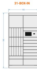
31-BOX-IN steering module V - 18 (61x655x260 mm) S - 9 (440x655x93 mm) M - 2 (440x655x201 mm)